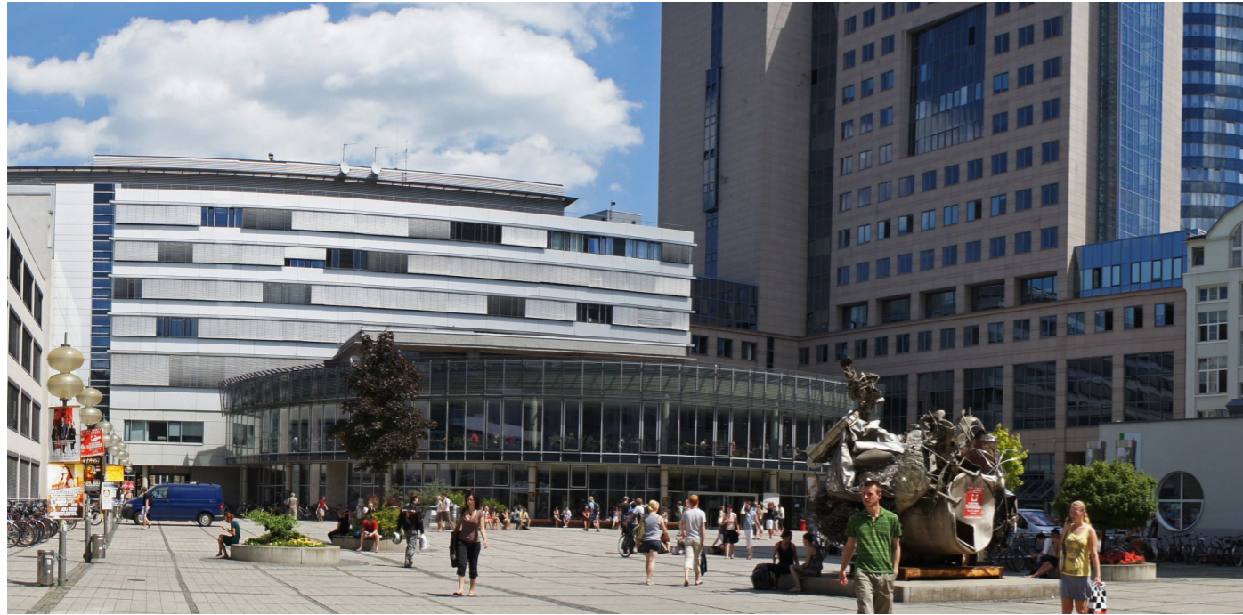
Campus mit Stella-Plastik