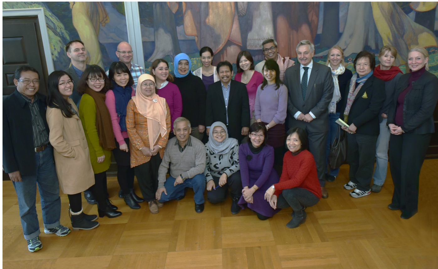
Studiengruppe Süd-ost-Asien während des Besuches in Jena