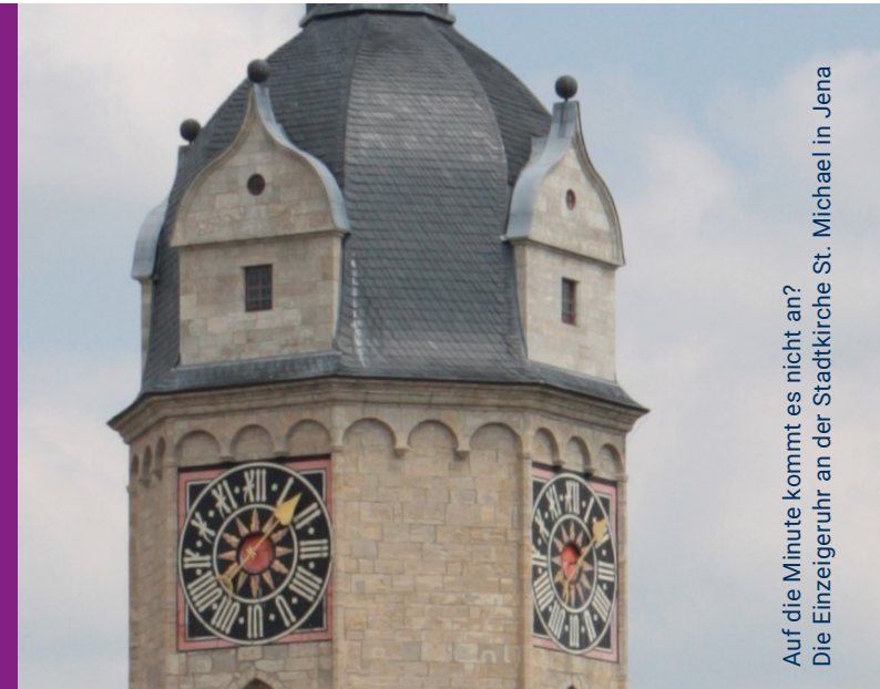
Auf die Minute kommt es nicht an? Die Einzeigeruhr an der Stadtkirche St. Michael in Jena