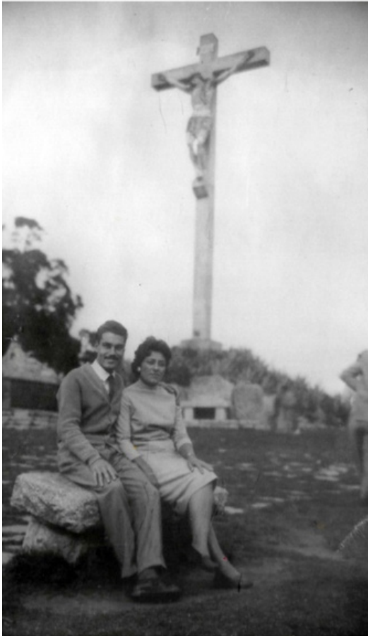
Imagen 6. Autor desconocido (Tandil, 1959). Archivo Fotográfico de las Vacaciones. Viajes por Argentina entre 1900-1969