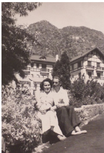
Imagen 5. Autor desconocido (Mendoza, circa 1949).