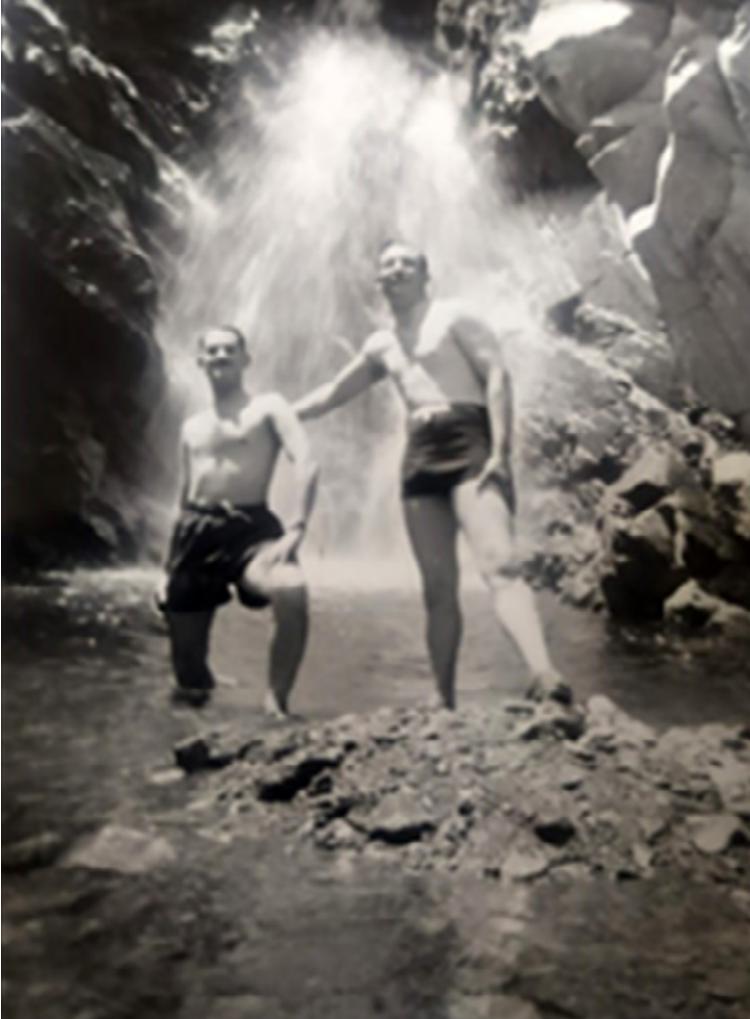
Imagen 1. Autor desconocido (San Luis, ca. 1945).