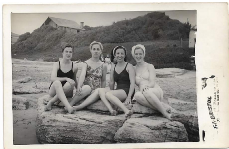
Imagen 3. Autor desconocido (Mar del Plata, 1952). Viajes por Argentina entre 1900-1969