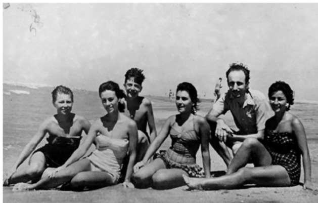
Imagen 2. Autor desconocido (Villa Gesell, 1960).