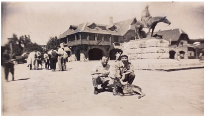
Imagen 4. Autor desconocido (Bariloche, circa 1955). Archivo Fotográfico de las Vacaciones. Viajes por Argentina entre 1900-1969