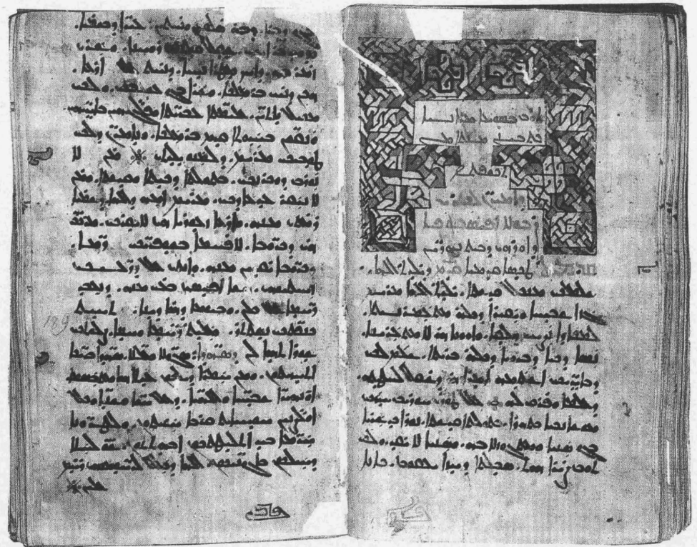
Abb. 101a Ein jakobitisches Ferialbrevier ( Bēt Gazzā ) Ms. orient. Ag 72, Bl. 88b/189a. 26x16 cm (22x13 cm). Syrisch (Sertā-Schrift). Abschrift 1548/49.