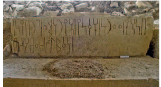
Abb. 5 DAI 'Addi 'Akawəḥ 2008–2.

Zeile 1–2: Der Text beginnt statt mit dem Subjekt in Gestalt des Namens des Stifters mit einem vorangestellten Präpositionalausdruck und weist damit eine Wortstellung auf, die für den ersten Satz einer altsüdarabischen Widmung unüblich ist. Dieselbe Wortstellung mit derselben Eingangsformulierung ( b-nḥy lm (2) n mlkn ) findet sich im zweiten Teil von RIÉ 63/B-cube/1f., einer Widmung aus Mātāra . Die reguläre Wortstellung mit dem Präpositionalausdruck b-nḥy w ʿ rn am Satzende zeigen dagegen zwei ebenfalls von sabäischen Steinmetzen gesetzte Widmungen (RIÉ 26, RIÉ 27) aus Goboçəla . Mit der Wendung b-nḥy w ʿ rn wird direkter Bezug auf die in unmittelbarer Nähe befindliche Altarinschrift des Kö-