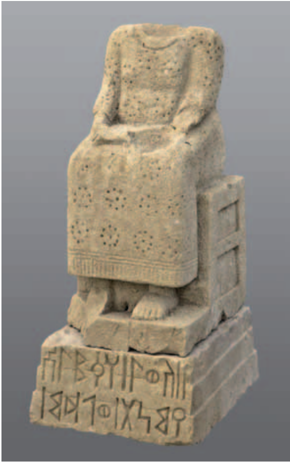
Abb. 6 DAI 'Addi 'Akawəḥ 2008-3, Sitzende Frau, Statue mit Sockel.

سك ٦: معبد لائل الأثري، عادي 'مخارج ٢٠٠٨-٣، نشر في دارعندة لائل جاندة، معبد لائل الأثري - (سك ٦)