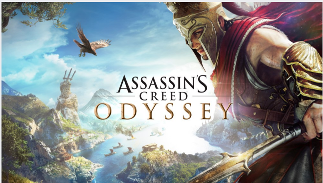
Assassin's Creed Odyssey, Ubisoft Entertainment

Herkules, Percy Jackson oder Assassin's Creed: Geschichten der Antike sind bei Kindern und Erwachsenen gleichermaßen beliebt. Als Hörbuch, Film oder Videospiel machen sie nicht nur Spaß, sondern vermitteln auch Inhalte der klassischen Archäologie. Doch welches Bild von antiker Geschichte zeichnen neue Medien? Welche Bedeutung haben Film, Hörbuch und Co. in der Wissensvermittlung? Diese und weitere Fragen werden von Experten aus Forschung, Bildung und den neuen Medien anhand zahlreicher Praxisbeispiele beantwortet.